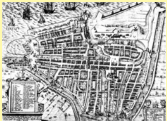
Oost- en West-Indiëvaarders op de rede van Rotterdam.

De handelsnederzetting Deshima, een kunstmatig eiland van 120 meter lang en 75 meter breed, in de Baai van Nagasaki vormde het venster van Japan op de rest van de wereld. Het aanvankelijk streng gereguleerde verblijf op het eiland (Het eiland niet verlaten, geen Hollandse vrouwen