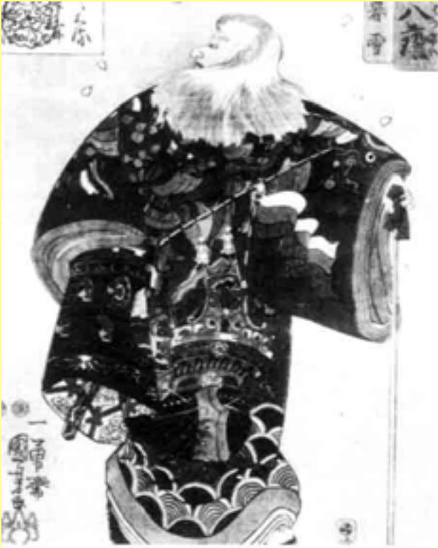
Afbeeldingen van westerse schepen werden gebruikt als versiering. Hier zelfs op een kimono. (Museum Namban Bunkakan, Osaka)

die de schepen kozen wees in de richting van een handelsreis rond Kaap de Goede Hoop. Alweer mis. Het doel van de reis werd pas onderweg aan de niets vermoedende bemanning medegedeeld. Voor kapitein Sebald de Weert van het 'Geloof' was het bericht aanleiding om onmiddellijk de steven te keren en elders zijn heil te zoeken. Het konvooi moest niet Kaap de Goede Hoop ronden, maar kreeg opdracht via Straat Magelhaen te varen en na een intensieve strooptocht langs de Spaanse handelsnederzettingen aan de kust van Zuid-Amerika de Molukken aan te doen. Sebald de Weert had verstandig gekozen. Geen van de vier resterende schepen zou ooit in Rotterdam terugkeren. De 'Blijde Boodschap' en de 'Trouw' vielen in handen van de Spaanse en Portugese vijand. De 'Hoop' verdween in de golven. De 'Liefde' zette koers naar Japan en voer twee jaar na het vertrek uit Rotterdam, met een sterk uitgedunde bemanning van 25 koppen, Beppoe-baai binnen. Op de lading - wollen stoffen en wapens, maar ook gekleurd glas, spiegels, brillen en kindertrompetjes - werd onmiddellijk beslag gelegd. Het lot van de bemanning werd in handen van de Japanse opperbevelhebber shogun Ieyasu gelegd.