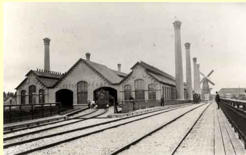
Ill. 2 Na de overname van de Nieuwe Rotterdamsche Gasfabriek door de gemeente Rotterdam (1884) werd deze ingrijpend verbouwd en uitgebreid. (Gemeentelijke Archiefdienst Rotterdam).

Daarmee is de kluis gekraakt. Ik ken nu de waarde van de Nieuwe Rotterdamsche Gasfabriek. De weinigzeggende balansgegevens zijn door