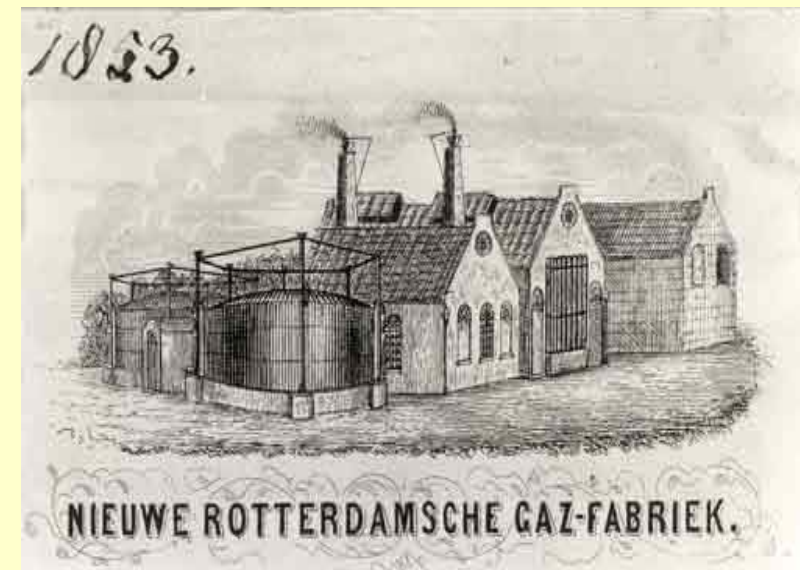
Ill. 1 De Nieuwe Rotterdamsche Gasfabriek aan de Oostzeedijk in 1853, kort na haar oprichting. (Anonieme staalgravure, Gemeentelijke Archiefdienst Rotterdam).

Dit artikel is toegespitst op de reactie van de N.V. Nieuwe Rotterdamsche Gasfabriek (NRG, 1852-1884) op de heffing van patentbelasting én op het effect dat die reactie had op haar bedrijfsadministratie. Door een opmerkelijke manipulatie van de boekhouding zag de NRG kans haar belastingplicht aanmerkelijk te verlichten. Diezelfde manipulatie vertekende de balansgegevens. De fabriek stond in 1884 voor nog slechts f 1835 op de balans. De gemeente Rotterdam, die dat jaar de gasfabricage