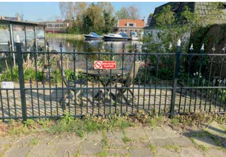
Op de plek waar in 1170 de eerste dam in de Rotte werd gelegd, staat nu een tafeltje en een paar stoeltjes met uitzicht op de Rotte.

Ten westen van de Rotte reikten de overstromingen van de twaalfde eeuw waarschijnlijk tot aan de kronkelende Kleiweg en de Kootsekade. De Kleiweg kronkelde omdat die was aangelegd op de stroomruggen van rivieren die het veen doorkruisten. Die staken net iets boven de omgeving uit en waren daardoor nuttig als weg en waterkering. Ten oosten van de Rotte bood de Oudedijk enige bescherming tegen hoog water. Voorzover nodig werden Kleiweg, Kootsekade en Oudedijk hersteld en met behulp van een dam in de Rotte met elkaar verbonden. Waar deze eerste dam de Rotte kruiste, staan nu een tafel en een paar stoelen met uitzicht op de Rotte.