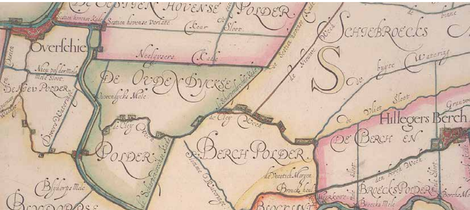
De Cley Wech, Detail uit de kaart van Schieland door Floris Balthasarsz. van Berckenrode (1611).

Rotterdammers hoef je meestal niet uit te leggen hoe de Rotterdamse geschiedenis in elkaar steekt, maar als het om de dam in de Rotte gaat, kan een korte opfriscursus geen kwaad.