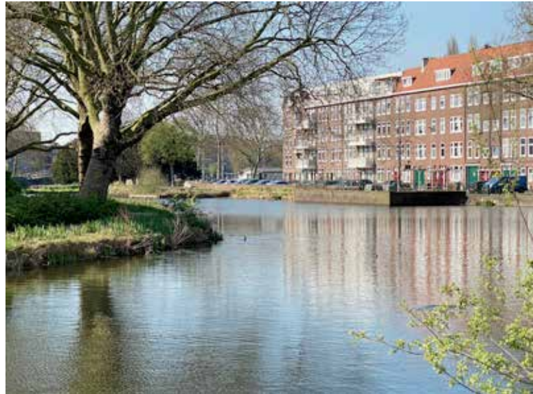
Omstreeks 1200 werd een tweede dam in de Rotte gelegd ter hoogte van de Crooswijksebocht.

Achter de Kleiweg en de Oudedijk was het betrekkelijk veilig, maar voor de dijk werd ook geboerd en gewoond. En na verloop van tijd waren ook daar dijken nodig om akker en woonplaats te beschermen. Ten westen van de Rotte hielden Beukelsdijk, Walenburgerweg en Bergweg het water tegen. Ten oosten namen Oudedijk en 's-Gravenweg de honneurs waar. Deze dijken dienden op de eerste plaats het eigenbelang van de polders, maar als ze op enkele punten met elkaar werden verbonden, zou dat de veiligheid van een veel groter gebied ten goede komen. Zo geschiedde en omstreeks 1200 werd als sluitstuk van die bedijking een tweede dam in de Rotte gelegd. Die passeerde de rivier een stuk zuidelijker in de Crooswijksebocht, vlakbij de huiskamer van Stichting Plezierrivier de Rotte.