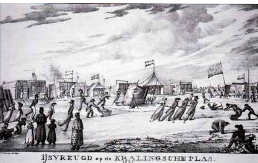
Ijsvreugd op de Kralingsche Plas (tekening D. Welle, 1827).

In 1839 werd de 4234 hectare grote Zuidplas drooggemalen. Het wel: vanaf 1697 waren daar al plannen voor gemaakt. Pas in 1825 werd overeenstemming bereikt over een plan in grote lijnen. Besloten werd om dertig windmolens en twee stoomgemalen in te zetten. Bij de aanleg van de 23 kilometer lange ringvaart kregen de uitvoerders te maken met verzakkingen, oppersingen, conflicten met aannemers en geldgebrek, maar in 1836 draaide de eerste windmolen en een jaar later begon het eerste stoomgemaal aan de klus. Het water werd in twee stappen opgepompt en gedeeltelijk op de Rotte geloosd, het meeste water werd op de Hollandsche IJssel gebracht. In 1839 vielen de eerste gronden droog. Tussen 1841 en 1843 werden ze verkocht. Na de samenvoeging in 2010 van de gemeenten Moordrecht, Nieuwerkerk aan den IJssel en Zevenhuizen-Moerkapelle werd de nieuw gevormde gemeente Zuidplas genoemd.