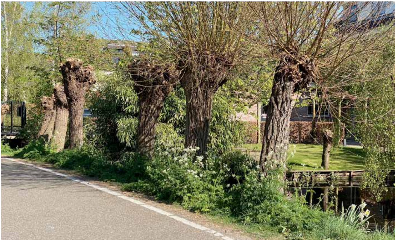
's-Gravenweg (foto Jan van den Noort, 2020)