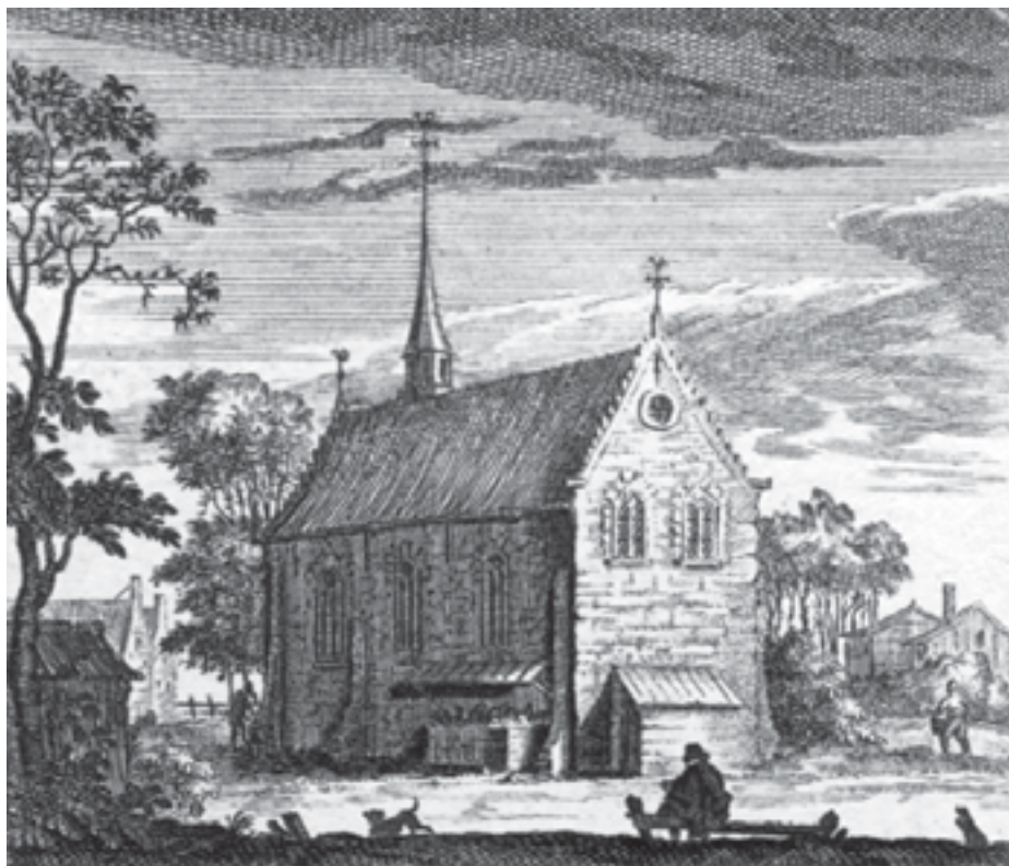
Afb. 2. De verplaatste kerk van Nieuwerkerk, kopergravure naar een afbeelding uit 1531 (Gemeentearchief Haarlem, atlas 27/7 (3318) cat. 1866).

heffingen die de graaf vanwege de landsheerlijkheid toekwamen. De bede waarom de graaf oorspronkelijk moest vragen, was in de 14de eeuw – toen de registratie ervan begon –, een bron van vaste inkomsten geworden. Datzelfde was het geval met de zogenaamde botting, die dateerde uit de Karolingische periode en diende om de koning en zijn leger te onderhouden. Herfstbeden werden volgens de oudste rekening van 1343 betaald door: Rietwijk samen met Schalkwijk (20 schelling), ‘Boesinghele’ (12 schelling 6 penning), ‘Haerlemmerwout’ (25 schelling), ‘Spaerne’ (3 schelling) en Haarlemmerliede (10 schelling). 16 Opmerkelijk in deze lijst is dat Rietwijk en Schalkwijk, die toch meer dan een kilometer uit elkaar liggen, bijeen zijn genomen. Voorts ziet men dat de naam Nieuwerkerk ontbreekt.