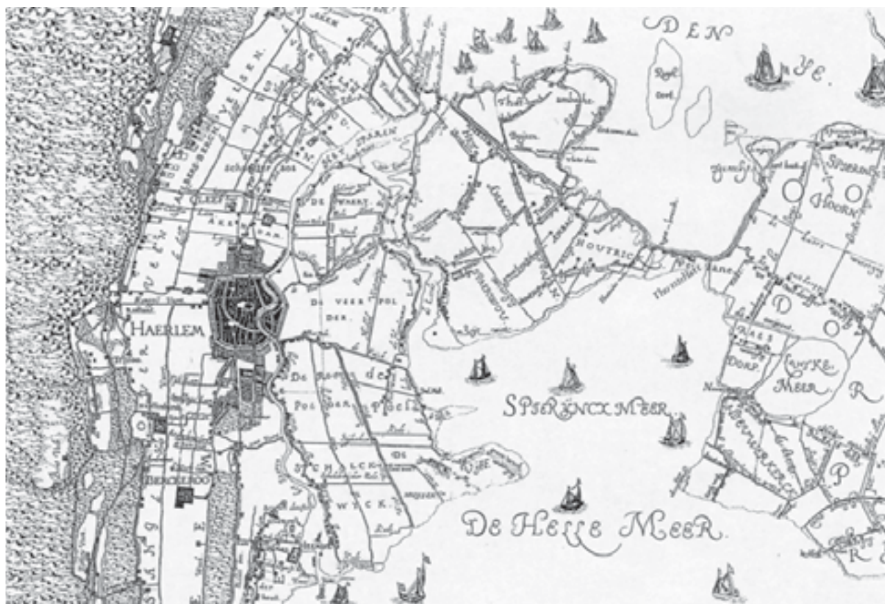
Afb. 1. Detail van de kaart van Rijnland door Floris Balthasars, 1615. Afdruk van de originele koperplaten (Hoogheemraadschap van Rijnland, Leiden).

de kerk niet verplaatst. Dat werd anders met de grote overstroming van 1509, 10 toen de kerk, zij het twee jaar later, vermindering kreeg van kerkelijke lasten. 11