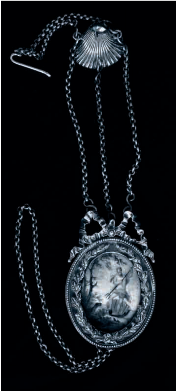
Afb. 1. De bodebus van het Hoogheemraadschap van de Hondsbossche (foto C. de Gooijer).