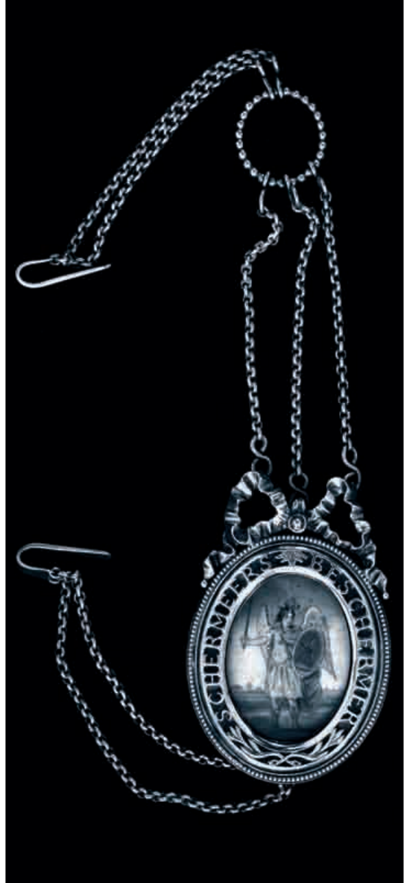
Afb. 2. De bodebus van de Schermer, stadskeur Alkmaar, jaarletter S (1802), meesterteken GIR.

De jaarsalarissen van de boden van de vijf hiervoor besproken waterschappen worden samengevat in tabel 1, waarin ter vergelijking tevens de beloningen van de overige polderbeambten zijn opgenomen. De bode van de Hondsbossche was met afstand de best betaalde. Mogelijk lag zijn salaris zo hoog om te zorgen dat hij minder gemakkelijk was om te kopen door de aannemers die aan de zeevering werkten. Voorts moest hij het uitsluitend met zijn bodesalaris doen omdat het hem, evenals de gerechtsdienaar van de Zijpe, expliciet verboden was nevenbetrekkingen te vervullen. Ten slotte moest de bode van de Hondsbossche altijd klaar staan, mocht hij zich ook nooit door een ander laten vervangen en was het hem zelfs verboden Petten te verlaten zonder permissie van de dijkgraaf of secretaris. Voor de volledigheid dient nog te worden opgemerkt dat in 1800 in de Heerhugowaard en Schermer onderwijzers, in laatstgenoemde polder tevens de brandmeesters/hooistekers en in de Zijpe ook nog de predikant op de loonlijst van de polder stonden. Dit