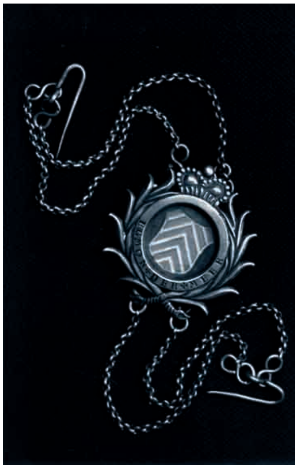
Afb. 4. De bodebus van de Egmondermeer. Stadskeur Alkmaar, jaarletter U (1804), meesterteken GIR.