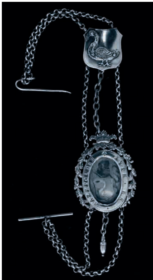
Afb. 5. De bodebus van de Zijpe en Hazepolder. Stadskeur Alkmaar, jaarletter V (1805), meesterteken GIR.