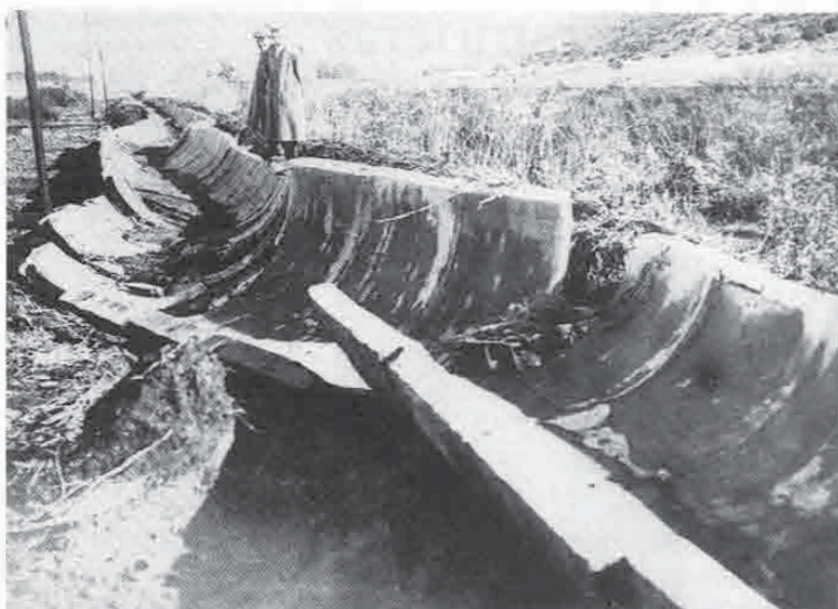
Afb. 2. Een door overstroming vernield irrigatiekanaal.

zuidelijke kanaal, 2700 m lang, voert naar de oude gemetselde stuwdam. Deze dam zou gedeeltelijk verlaagd moeten worden om de overlaathoogte van 4.00 m te verminderen tot 2.20 m. De overblijvende valhoogte van het water zou dan benut kunnen worden om elektrische stroom op te wekken voor de aandrijving van irrigatiepompen bij de Timsachiwaterbronnen. De opbrengst van de generator zou 50 pk zijn. Om de 300 m werden laterale tochten ontworpen voor de ontwatering van het land en voor de afvoer van het drainwater naar het hoofdkanaal.