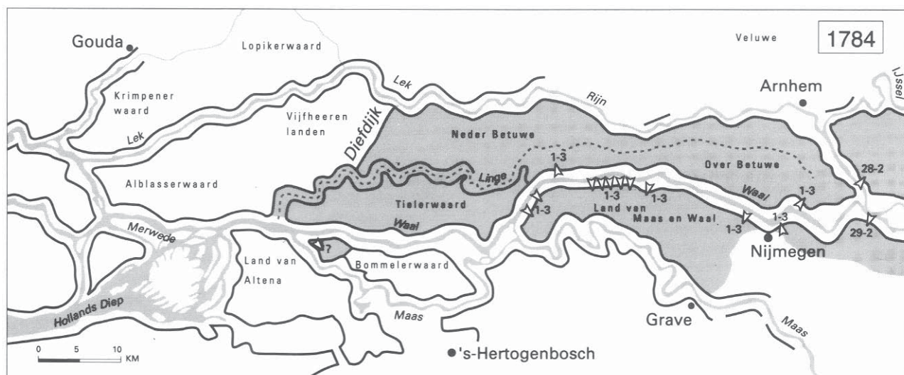
Afb. 1. De dijkbreuken en overstromende delen van het Nederlandse rivierengebied in 1784. Bron: Driessen, Watersnood tussen Maas en Waal , 132.

In de getroffen landstreken woonden ruim 60.000 mensen. 4 Hun schrik en de ontzetting waren groot. Ze moesten veelal in het nachtelijke duister en de kou met hun vee en wat ze verder nog aan bezittingen konden nemen, ijlings de wijk nemen voor het snel opdringende water en ijs. Ze vluchtten naar de dichtstbijzijnde dijken, kerken of andere hoge plaatsen of naar de zolders of daken van hun huizen. Vooral in en om Millingen, waar het water zo onverhoeds en snel kwam, was de situatie kritiek. Sommigen konden nog op het nippertje in hun huis naar boven vluchten met achterlating van have en goed. Veel vee kwam om. In Beesd, meer naar het westen, zochten de meeste inwoners inderhaast hun toevlucht in het raadhuis. Tiel liet de stadspoorten dag en nacht open voor vluchtenden. De stad zat spoedig vol met vluchtelingen. Door haar hoge ligging werd Tiel ook bij deze overstromingsramp een toevluchtsoord voor de getroffen en uit de lager gelegen plaatsen in de omgeving. Terecht zou na de evacuatie van 1995 hierop gewezen en deze ontruiming onnodig genoemd worden. 5 Opmerkelijk is dat er bij de ramp van 1784 relatief weinig doden vielen. Het scheelde dat men in het westelijke deel van het rivierengebied enig respijt had, zij het minder dan verwacht, voordat daar het overstromingswater kwam. De meeste slachtoffers vielen op Duits grondgebied, waar de eerste doorbraken ontstonden, en later in Nijmegen, waar acht van de negen opvarenden van een reddingsboot verdronken. 6