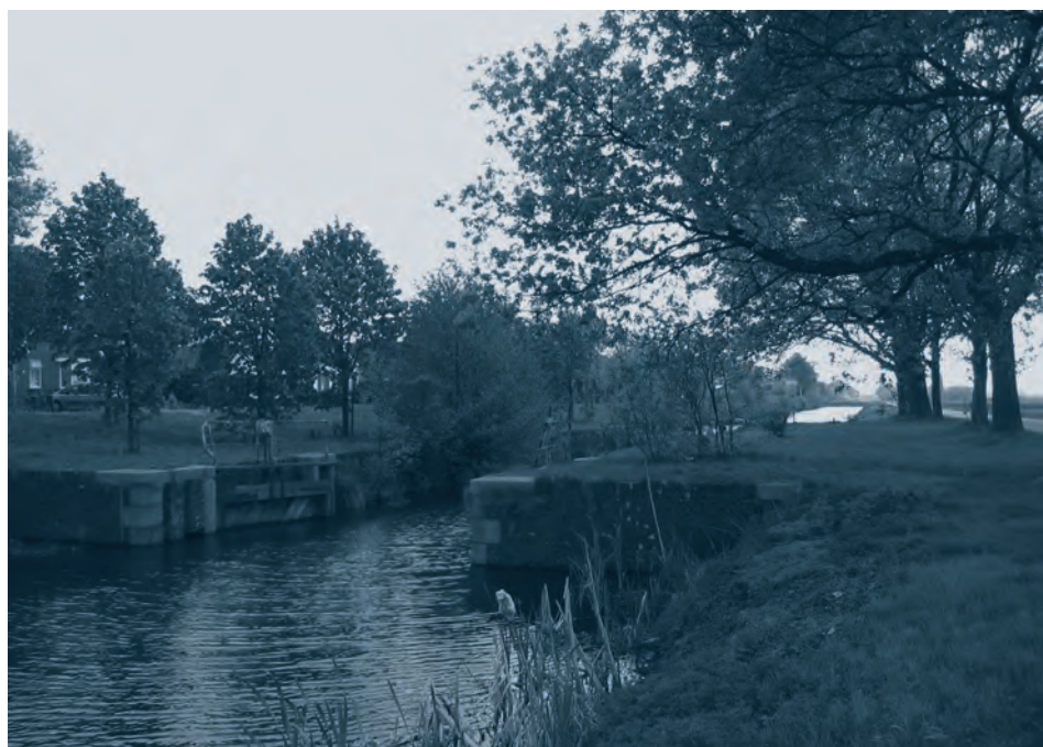
Afb. 1. De te restaureren sluis in het Verlengde Oosterdiep bij Barger-Compasuum.

Op 11 december 2009 vond in Hoofddorp de presentatie plaats van het boekje Leeghwater en het Haarlemmermeer . Het gaat om een coproductie van de Vrienden van de Hondsbosche, kring voor Noord-Hollandse waterstaatsgeschiedenis, en het Hoogheemraadschap