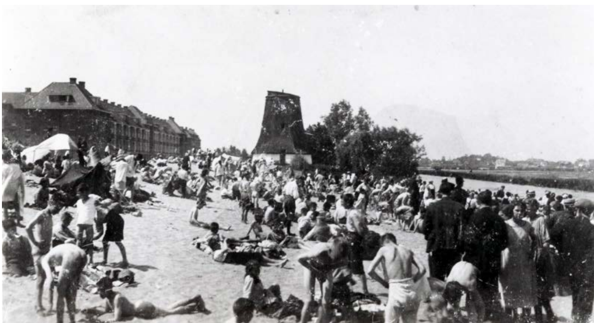
Badplaats Reserveboezem (ca 1905).