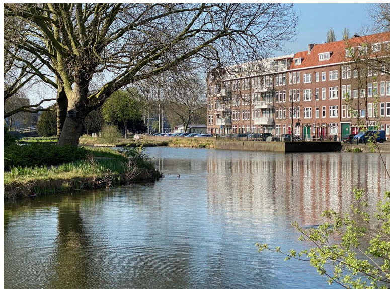
Omstreeks 1200 werd een tweede dam in de Rotte gelegd ter hoogte van de Crooswijksebocht.

Achter de Kleiweg en de Oudedijk was het betrekkelijk veilig, maar voor de dijk werd ook geboerd en gewoond. En na verloop van tijd waren ook daar dijken nodig om akker en woonplaats te beschermen. Ten westen van de Rotte hielden Beukelsdijk, Walenburgerweg en Bergweg het water tegen. Ten oosten namen Oudedijk en 's-Gravenweg de honneurs waar. Deze dijken dienden op de eerste plaats het eigenbelang van de afzonderlijke polders, maar als ze op enkele punten met elkaar werden verbonden, zou dat de veiligheid van een veel groter gebied ten goede komen. Zo geschiedde en omstreeks 1200 werd als sluitstuk van die bedijking een tweede dam in de Rotte gelegd. Die passeerde de rivier een stuk zuidelijker in de Crooswijksebocht, vlakbij de huiskamer van Stichting Plezierrivier de Rotte .