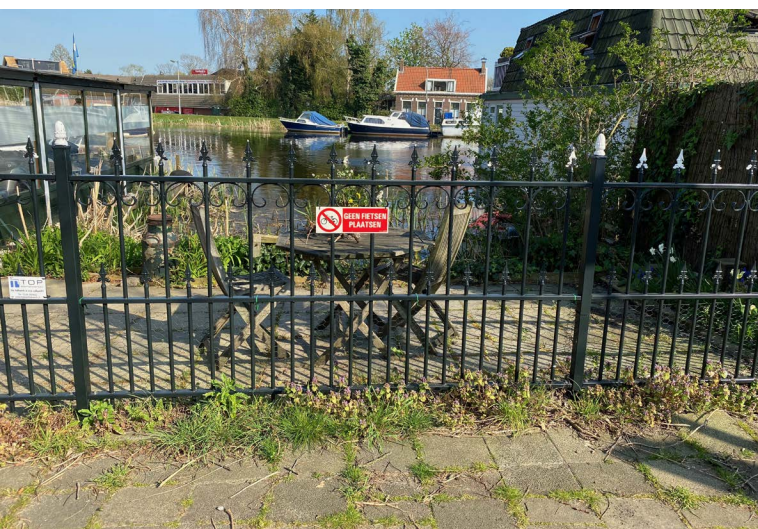
Op de plek waar in 1170 de eerste dam in de Rotte werd gelegd, staat nu een tafeltje en een paar stoeltjes met uitzicht op de Rotte (foto Jan van den Noort 2020).

Ten westen van de Rotte reikten de overstromingen van de twaalfde eeuw waarschijnlijk tot aan de kronkelende Kleiweg en de Kootsekade. De Kleiweg kronkelde omdat die was aangelegd op de stroomruggen van rivieren die het veen doorkruisten. Die staken net iets boven de omgeving uit en waren daardoor nuttig als weg en waterkering. Ten oosten van de Rotte bood de Oudedijk enige bescherming tegen hoog water. Voorzover nodig werden Kleiweg, Kootsekade en Oudedijk hersteld en met behulp van een dam in de Rotte met elkaar verbonden. Waar deze eerste dam de Rotte kruiste, staan nu een tafel en een paar stoelen met uitzicht op de Rotte.