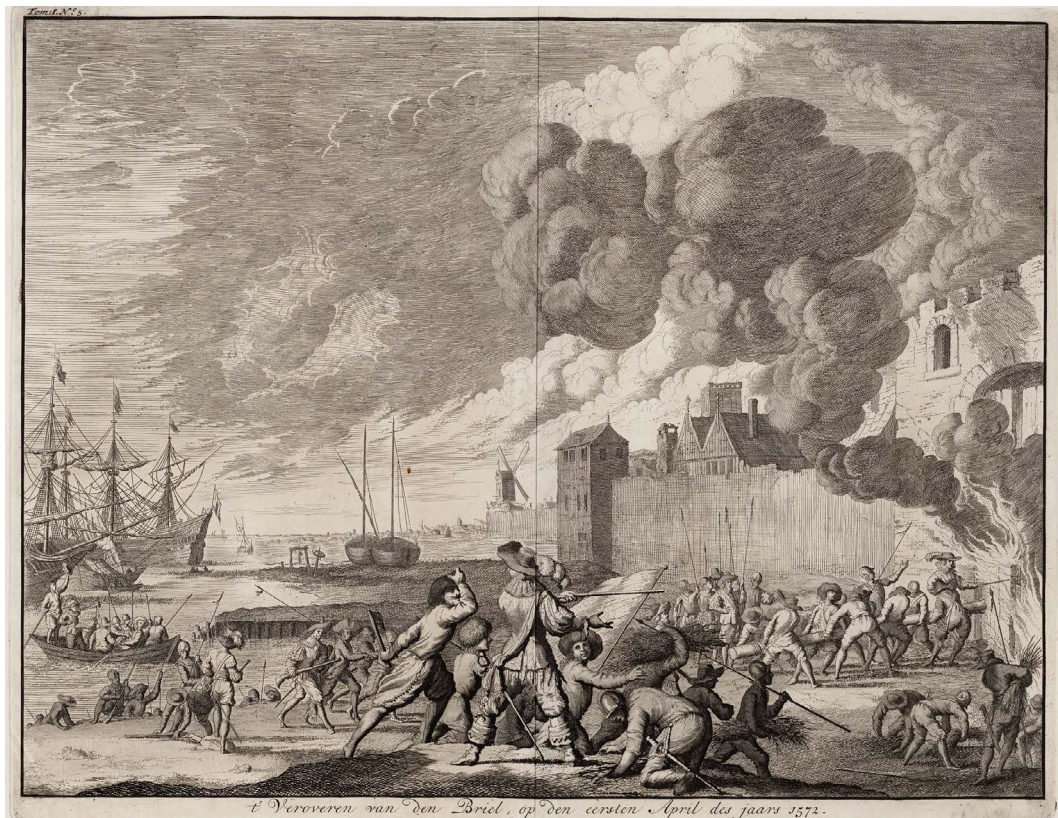
t Veroveren van den Briel, op den eersten April des jaars 1572.

Op de lagere school leerden we het al: Op 1 april verloor Alva zijn bril. We hadden toen geen idee waar het over ging, maar inmiddels is duidelijk dat landvoogd Fernando Álvarez de Toledo, kortweg Alva , op die dag in 1572 een grote nederlaag leed. De Geuzen veroverden Den Briel en dat smaakte naar meer. Alva sloeg keihard terug, maar bij het beleg van Haarlem en Alkmaar verloor hij erg veel manschappen. Bij het eerste beleg van Leiden (1573-1574) had Alva evenmin een gelukkige hand. De stad was al vroeg op de hoogte van de Spaanse plannen en kon zich op het ergste voorbereiden door grote voorraden levensmiddelen in te slaan. Na een korte onderbreking in het voorjaar van 1574 werd het beleg hervat. De Spanjaarden die de stad wilden uithongeren hadden nu meer kans van slagen omdat Leiden de onderbreking niet had benut voor het aanvullen van de levensmiddelenvoorraad.