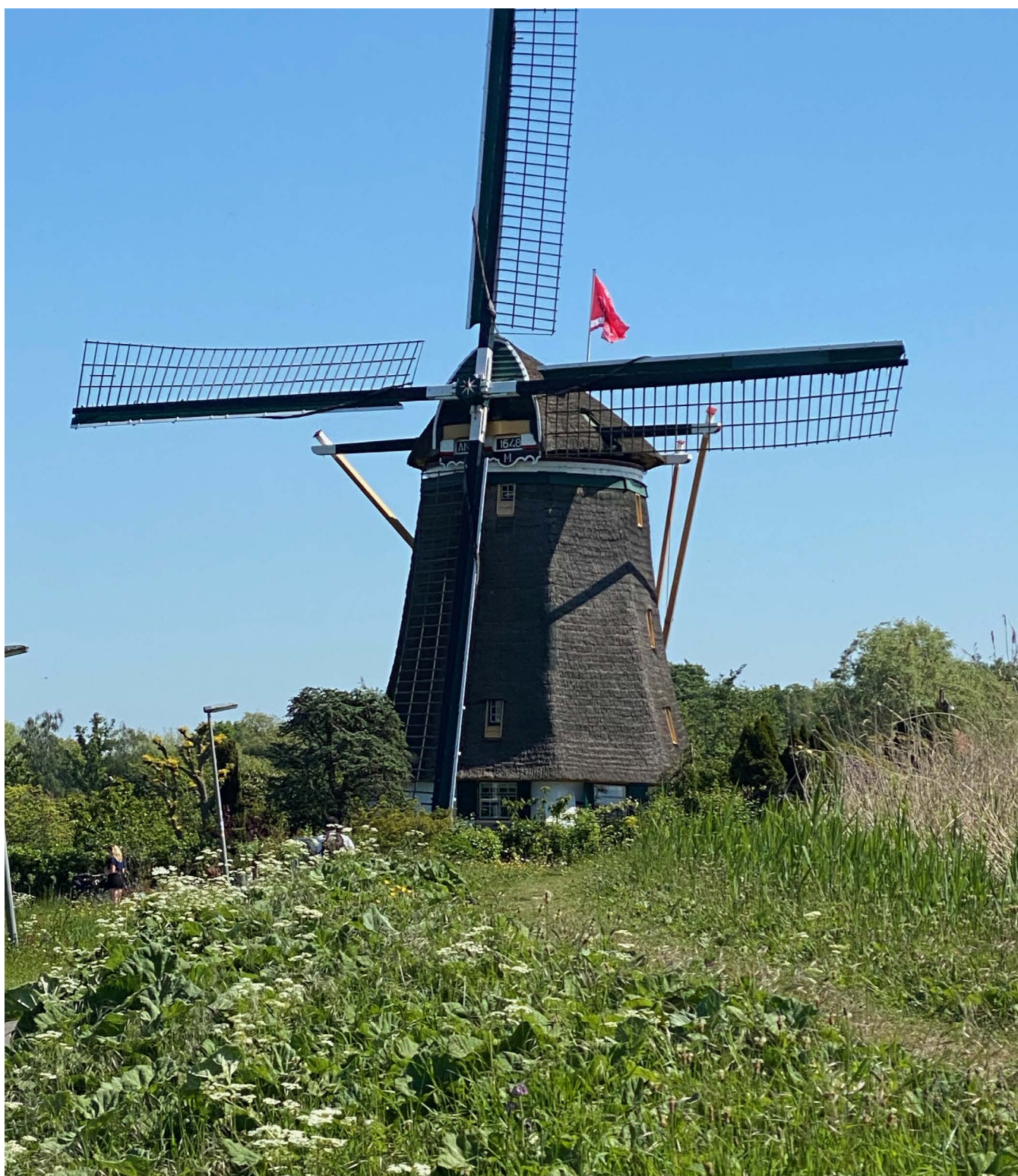
De Prinsenmolen in Hilligersberg, gebouwd in 1648